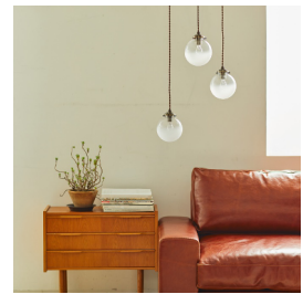
<取り扱い商品イメージ>